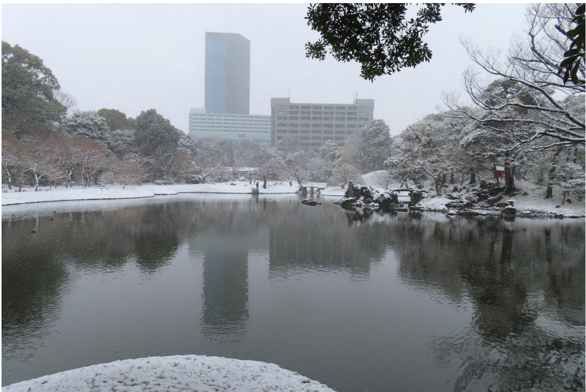
庭園の中心となる景観